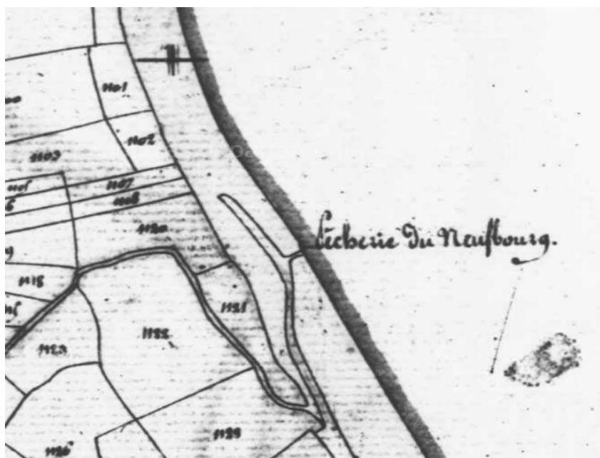
Source : Cadastre Napoléonien, 1825

A l'instar d'autres rivières de Normandie (Sienne, Vire, Orne...) et de Bretagne (Ellé, Aulne...), la Sélune comptait de nombreuses pêcheries destinées à prendre des saumons. Il pouvait s'agir de simples filets tendus en travers de la rivière (Montmorel, Ducey) ou au niveau des seuils de moulins (Ducey, La Roche, Vezin, Virey...) mais le plus souvent l'activité de pêche s'appuyait sur des aménagements dédiés. Des murs en pierre, « les perrés », barraient en effet le cours de la rivière pour conduire les poissons vers le « trou commun » où était placé un filet.