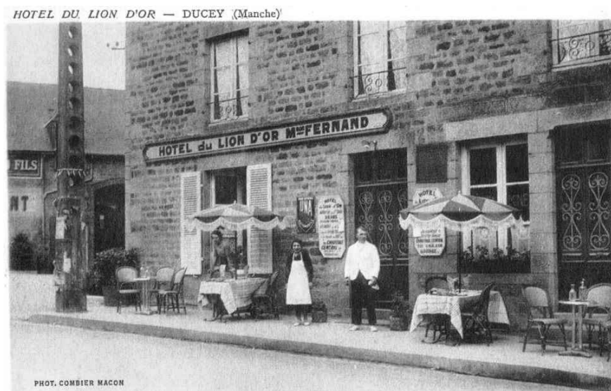
Le confort en plein centre de pêche, à proximité du Mont St-Michel (vacances agréables)

« Le confort en plein centre de pêche à proximité du Mont St Michel (Vacances agréables) ». Cette carte postale de l'Hôtel du Lion d'Or à Ducey témoigne de l'apparition d'un tourisme pêche sur la Sélune dès les années 1920/1930. Il s'agissait alors probablement de pêcheurs aisés qui disposaient du temps et des revenus nécessaires pour venir passer plusieurs jours à la pêche à Ducey. A partir des années 1950, le tourisme pêche s'est ouvert aux classes moyennes. Mais le déclin des populations de saumons sur la Sélune a contrarié le développement de cette activité économique. Le tourisme pêche à Ducey a totalement disparu dans les années 1990.