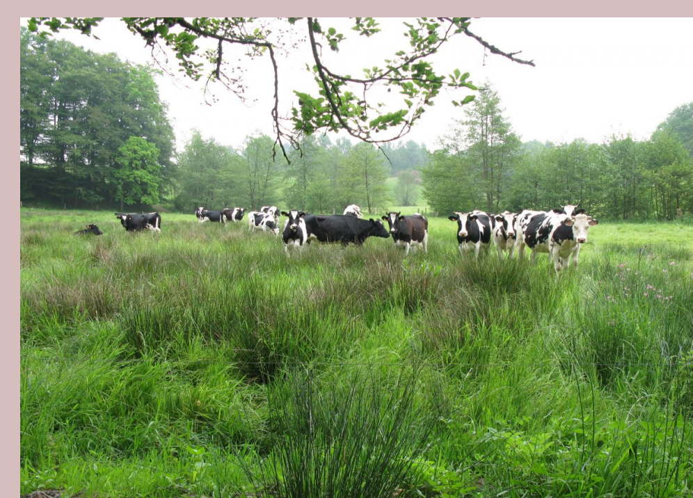
Gestion agro-environnementale des zones humides