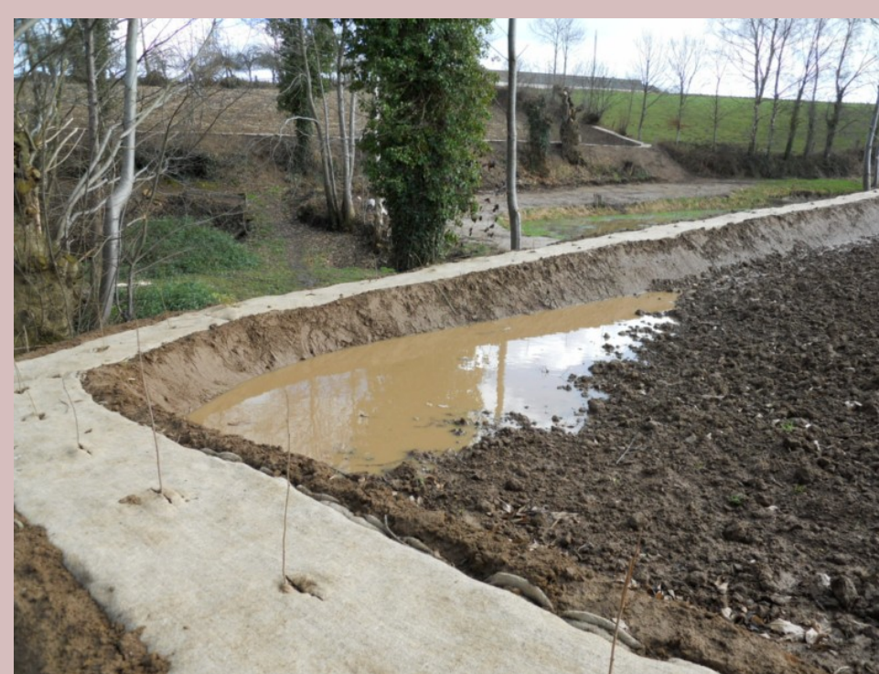
Création de talus anti-érosif